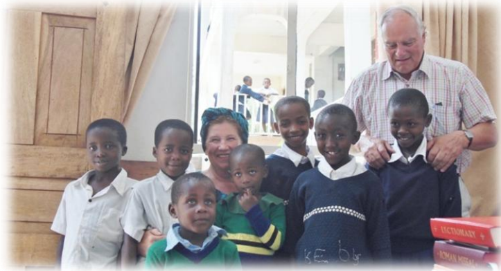
Mweka Primary School

Zoals elk jaar hebben we ook dit jaar de lagere scholen bezocht waar de CNCC kinderen naar school gaan. De vijf jongens waarover we het in onze vorige brief hadden en die in Mweka op school zitten, zijn op deze school gebleven. Ze zagen er nu beter uit dan het vorige jaar. Vier van hen zitten in groep vijf en eentje in groep zes (er zijn in totaal zeven groepen). Twee kleintjes zitten op de kleuterschool aldaar en wonen weer bij hun familie in de buurt van de school.