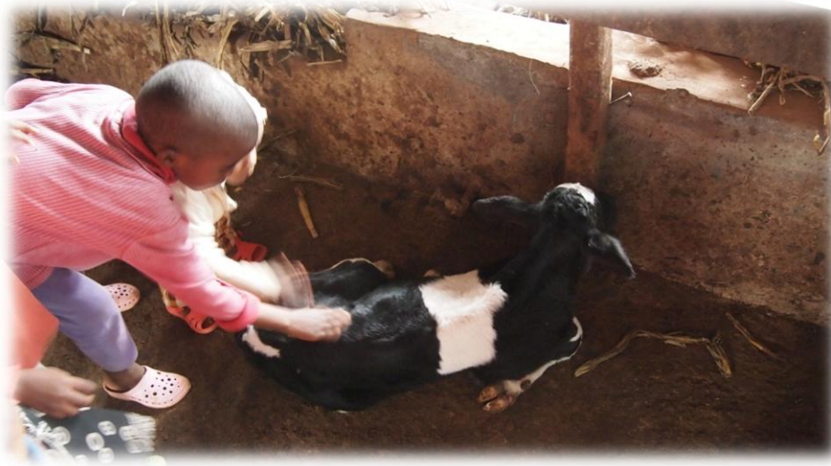
Kinderen begroeten het kalfje

De grote koeienstal wordt teruggebracht tot een kwart en de rest wordt kippenstal. Verder zijn er een paar hobby...(tot kerst?) kalkoenen geschonken aan de zusters.