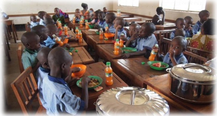
Bezoekers zondag, de kinderen genieten van de vruchtensap en de pilau